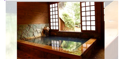
内湯「ひのきの湯」 ひのき湯(内湯男女)