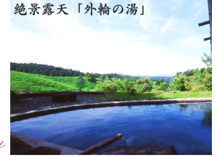
絶景露天「外輪の湯」 展望露天風呂「外輪の湯/混浴」